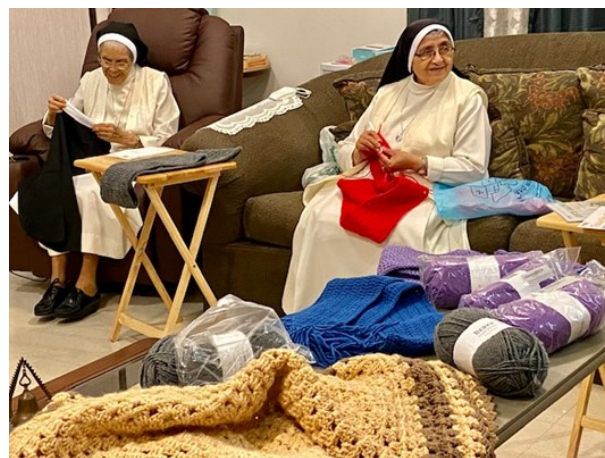
Hermanas Mercedarias del Santísimo Sacramento en la casa de retiro.

Las Hermanas que pertenecemos a AHLMA nos damos la mano y damos la mano a quienes la necesitan, a aquellos que no saben, no quieren o ¡ni siquiera han oído de la hermandad! Nuestro puente está construido de sonrisas, palabras de ternura, manos que ayudan, levantan y conectan, en concreto FRATERNIDAD, SOLIDARIDAD y SORORIDAD. El corazón de cada hermana en AHLMA es un corazón atento al hambre del hermano(a) y nos hacemos Eucaristía, alimento para la vida de los demás.